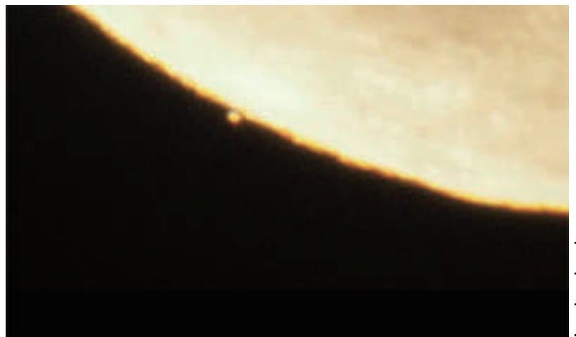
右写真：2022年7月21日に見られた火星食

今年は、このうちアンタレスとスピカの両方の星食が見られます。アンタレス食は6月20日(木)の夕方に見られました。スピカ食は8月10日(土)と12月25日(水)に見られます。また、7月25日(木)と12月8日(日)には土星食も起こります。特に8月10日のスピカ食は、宵の西の空でとても良い条件で見ることができます。